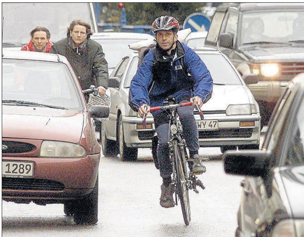
Durchlavieren auf zwei Rädern: Dieser Radfahrer trägt zwar anders als die beiden Radler hinter ihm einen Helm, dafür schlängelt er sich verkehrswidrig zwischen zwei Autokolonnen durch.

Die Gewerkschaft der Polizei (GdP) forderte mehr Mittel, um die Vergehen von Radfahrern besser ahnden zu können. Angesichts einer ausgedünnten polizeilichen Verkehrsüberwachung erscheine Ramsauers Vorstoß, Kampfradler mit härteren Strafen zu drohen, eher hilflos.