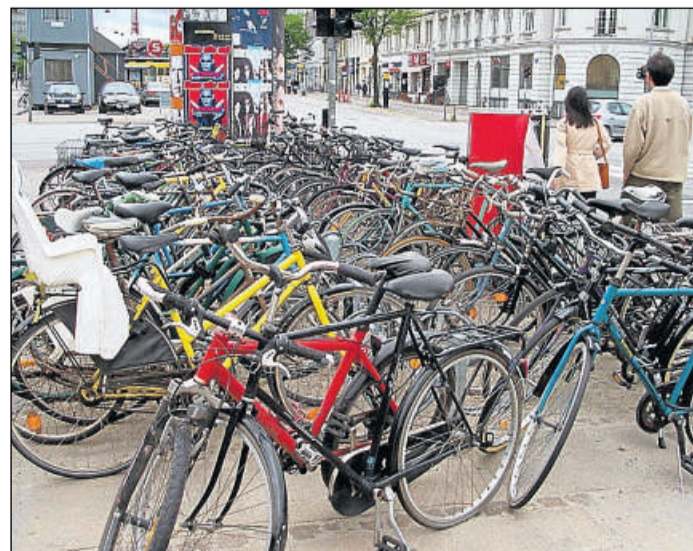
Hauptverkehrsmittel: Über die Hälfte der 1,2 Millionen Einwohner Kopenhagens nutzt das Fahrrad für tägliche Wege.

Eine ähnliche Rechnung macht die Kopenhagener Stadtverwaltung auf: Ein Kilometer Fahrradweg koste 8 Millionen Kronen (1,1 Millionen Euro), der Ausbau von einem Kilometer Autobahn aber 70 bis 100 Millionen, ein Kilometer Metro gar eine Milliarde Kronen. (dpa)